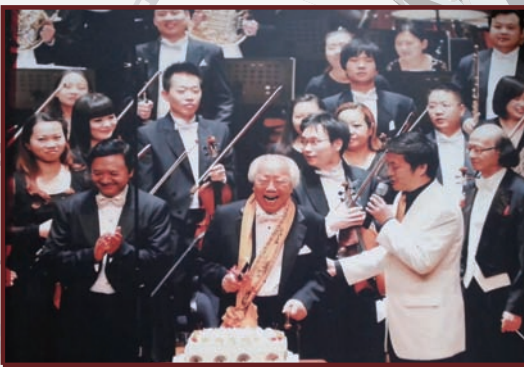
二、2013年9月15日，作为上海交响乐团开幕演出季的第三场演出，在东方艺术中心举行的“耄耋桃李，黄晓同80华诞师生专场”，指挥台上，老人气定神闲地扬起指挥棒，“一代宗师”的气场令全场屏息。全场热闹欢腾的音乐会，最终以一曲深沉舒缓的《天方夜谭》压轴收尾。图为音乐会末尾，几位学生推上蛋糕为老师唱响生日歌的场面充满了温馨与感动。