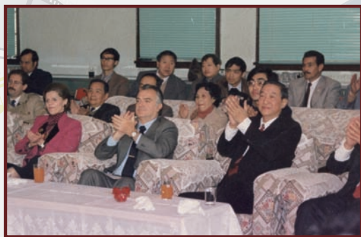
一、1986年12月8日，墨西哥总统米格尔·德拉马德里、乌尔多及夫人由上海市副市长刘振元陪同，来我院访问。图为桑桐院长陪同参观我院师生演出。