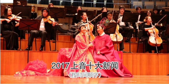
2017上音十大新闻 (按时间顺序)