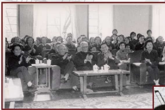
1979年4月27日,钢琴家傅聪文革后第一次回国前来我院访问,并在小礼堂举行钢琴独奏和教学,我院师生争相进场,致使挤坏门窗,盛况空前。图片前排左起:周小燕、丁善德、贺绿汀、傅聪、吴乐懿。